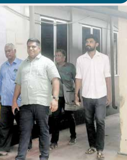
கூட்டமைப்பு மன்னார் மாவட்டத்தில் நான்கு உள்ளூராட்சி மன்றங்களுக்கான கட்டுப்பணத்தைச் செலுத்தியுள்ளது.