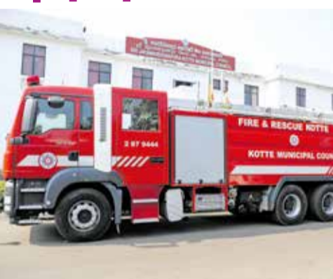
டிய பணிகள் குறித்தும் இங்கு கலந்துரையாடப்பட்டன.

சேவை வழங்கலின்போது ஏற்படும் பிரச்சினைகளைத் தவிர்ப்பதற்கு சேவையை முறையாக மேற்கொள்வதற்காக தீயணைப்புச் சேவைக்காக தேசிய திட்டமொன்றைத் தயாரிப்பதற்கு அரசாங்கம் கவனஞ்செலுத்தியுள்ளதாக மாகாண சபைகள் மற்றும் உள்ளூராட்சி அமைச்சர் பிரபா ருவன் செனரத் தெரிவித்தார். கொழும்பு மாவட்ட செயலகத்தில் நேற்று முன்தினம் (10) நாடு முழுவதுமுள்ள அனைத்து தீயணைப்புப் பிரிவுகளினதும் தலைமை அதிகாரிகளுடன் நடைபெற்ற கலந்துரையாடலின்போதே அவர் இதனைத் தெரிவித்தார். தலதா மாளிகை பெரஹெரவுக்காக தீயணைப்புப் பிரிவினால் செய்யப்பட வேண்டிய பணிகள் குறித்தும் இங்கு கலந்துரையாடப்பட்டன. தற்போதுள்ள பிரச்சினைகளைக் குறைத்து பிற பண்டுகைக் காலங்களில் வழங்கப்படும் சேவைக்கும் மேலாக தரமான சேவையை