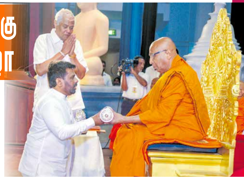
தலைமையிலான சங்க சபைக்கு சமர்ப்பிக்க நடவடிக்கை எடுக்கப்படும்"- என்றார். மகாநாயக்க தேரரின் வாழ்க்கை வரலாறு குறித்த நினைவுப் புத்தகமும் ஜனாதிபதியிடம் வழங்கப்பட்டது. இந்நிகழ்வில் மூன்று நிக்காயக்களின் மகா சங்கத்தினர்கள், முன்னாள் ஜனாதிபதிகள்,

பயனளிக்காது. நாட்டின் வீழ்ச்சியடைந்துள்ள சமூகக் கட்டமைப்பை சட்டத்தின் மூலம் மட்டும் சீர்ப்படுத்த முடியாது. நாட்டில் கருணையுள்ள சமூகம் கட்டியெழுப்பப்பட வேண்டும். புத்தபெருமான் உட்பட அனைத்து மத குருமார்களும் உபதேசித்த மீட்சியின் சாராம்சம் குறித்த வலுவான கருத்தாடல் நாட்டுக்கு உடனடியாகத் தேவை. பெளத்த கருத்தாடல் சட்டம் தொடர்பாக மகாநாயக்க தேரர்களுடன் தற்போது கலந்துரையாடல்கள் நடைபெற்று வருகின்றன. விகாரை தேவாலயம் சட்டத்தின் பிரிவு 41 மற்றும் 42க்கான திருத்தங்கள் விரைபு செய்யப்பட்டுள்ளன. அவை விரைவில் அமைச்சரவையில் சமர்ப்பிக்கப்பட்டு பாராளுமன்றத்தில் நிறைவேற்றப்பட்ட பின்னர் சங்க நிறுவனத்தை முறைப்படுத்துவதற்குத் தேவையான அதிகாரத்தை மகாநாயக்க தேரர்