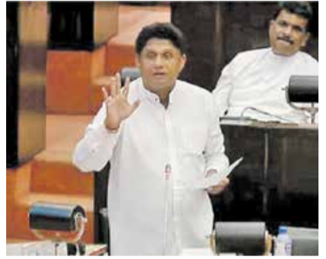
அரசாங்கம் முன்னெடுத்த ஏதேனும் ஆய்வுகள் உண்டா? அவ்வாறானால், எடுக்கும் காலத்தை தனித்தனியாகக் குறிப்பிடவும்.

02. உயர் தரத்தில் கலை, வணிகம், விஞ்ஞானம் மற்றும் தொழில்நுட்பம் ஆகிய பாடங்களை பயிலும் மாணவர்கள், தங்கள் பட்டப்படிப்பு முடிவடையும் திகதியிலிருந்து வேலை கிட்டும் வரை எடுக்கும் காலம் தொடர்பில்