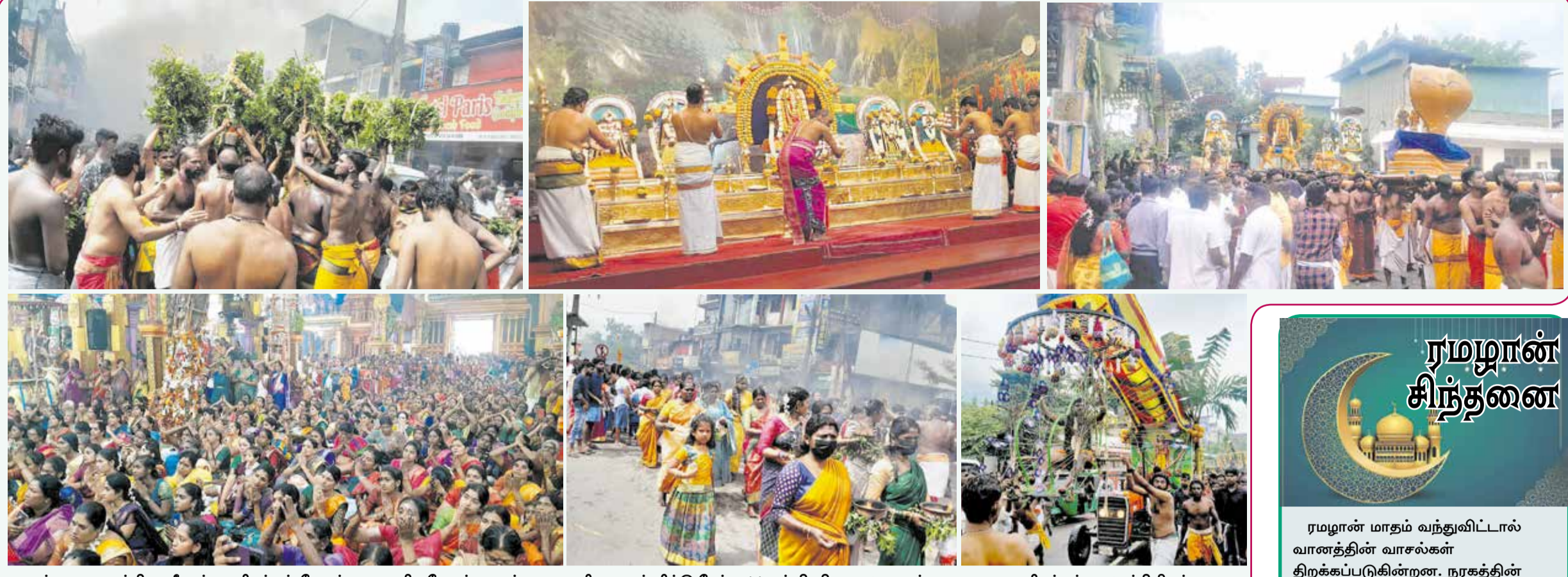
மாத்தளை அருள்மிகு ஸ்ரீ முத்துமாரியம்மன் தேவஸ்தான மாசி மஹோற்சவ பஞ்சரத பவனியை முன்னிட்டு நேற்று 11ஆம் திகதி காலை சுதுகங்கை ஏழுமுக காளியம்மன் ஆலயத்திலிருந்து காவுட ஊர்வலம், வேல்பூட்டு, பறவைக்காவுட, தீச்சட்டி ஏந்துதல் என்பன ஆரம்பமாகி மாத்தளை பிரதான வீதியூடாக ஆலயத்தை சென்றடைந்து தீமிதிக்கும் வைபவம் நடைபெற்று, விசேட வசந்த மண்டப பூஜையுடன் பக்தர்களுக்கு அன்னதானமும் வழங்கப்பட்டது.