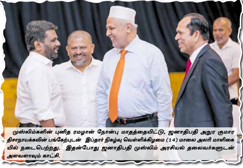
முஸ்லிம்களின் புனித ரமழான் நோன்பு மாதத்தைப்பிட்டு, ஜனாதிபதி அநுர குமார திசாநாயக்கவின் பங்கேற்புடன் இப்பதர் நிகழ்வு வெள்ளிக்கிழமை (14) மாலை அலரி மாளிகையில் நடைபெற்றது. இதன்போது ஜனாதிபதி முஸ்லிம் அரசியல் தலைவர்களுடன் அளவளாவுக காட்சி.