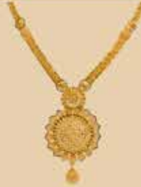
Haram NEK 473 Harams