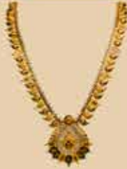
Haram NEK 318 Harams