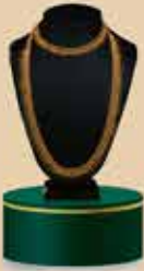
Bridal Set NEK 106 / 375 Harams