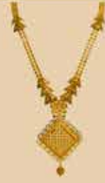
Haram NEK 477 Harams