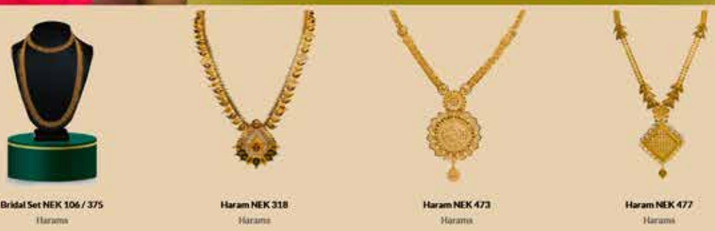
Bridal Set NEK 106 / 375 Harams Haram NEK 318 Harams Haram NEK 473 Harams Haram NEK 477 Harams