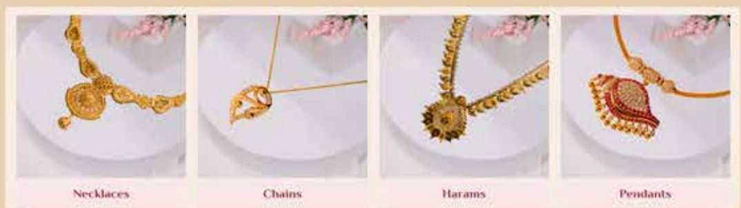
Necklaces Chains Harams Pendants

2900 Markham Rd Unit A30, Toronto, ON M1X 1E6, Canada