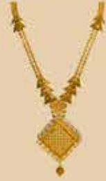
Haram NEK 477 Harams