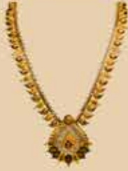
Haram NEK 318 Harams