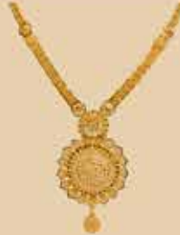
Haram NEK 473 Harams