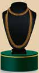
Bridal Set NEK 106 / 375 Harams