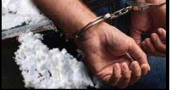
சந்தேகநபரிடமிருந்து 496,000 ரூபாவும் பொலிஸாரால் கைப்பற்றப்பட்டது.

இதேவேளை, இரத்தமலாணை மெலிபன் சந்திக்கருகில் முன்னெடுக்கப்பட்ட சுற்றிவளைப்பில் 800 கிராம் ஐஸ் போதைப்பொருளுடன் ஒருவர் கைது செய்யப்பட்டுள்ளார். இரத்தமலாணை பகுதியைச் சேர்ந்த 29 வயதான குறித்த