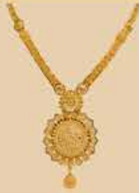
Haram NEK 473 Harams