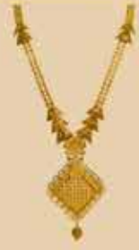
Haram NEK 477 Harams