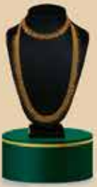
Bridal Set NEK 106 / 375 Harams