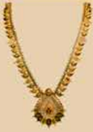
Haram NEK 318 Harams