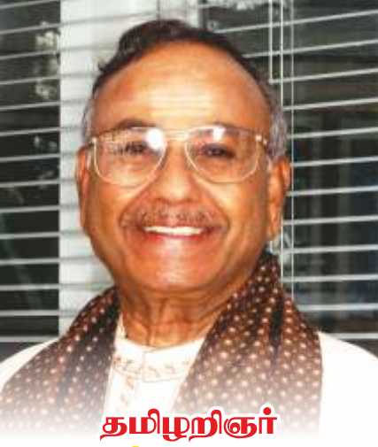
தமிழறிஞர் கோபன் மகாதேவா மறைவு