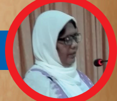
பாலையூற்று அஹ்ரயா நார்தீன்

சொற்கள் இனி வெய்யிலின் நிறத்தைப் பூசிக் கொள்ளும்.