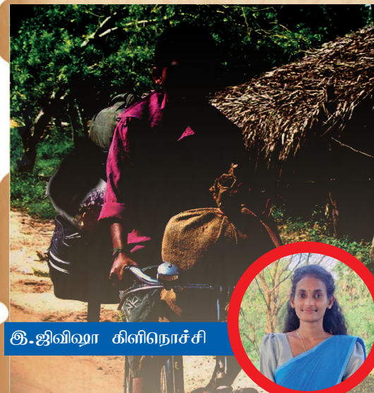
இ. ஜிவிஷா கிளிநொச்சி

பென்னெனும் அமிலத்தில் விழுந்த காதலெனும் காரத்துளி!