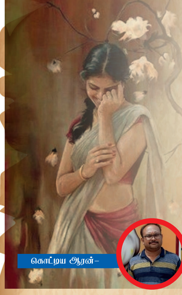
கொடைய ஆரன் -

ஒரு சின்ன நிசபத்தின் பெரு வெளியை நகர்த்த நிமிரும் நாக்கினியின் உட தெம்பு!