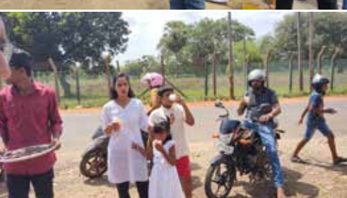
இதன்போது குளிப்பானம், பிஸ்கட் என்பவற்றை வழங்கி தமது நல்லிணக்கத்தை வெளிப்படுத்தியிருந்தனர். 100-