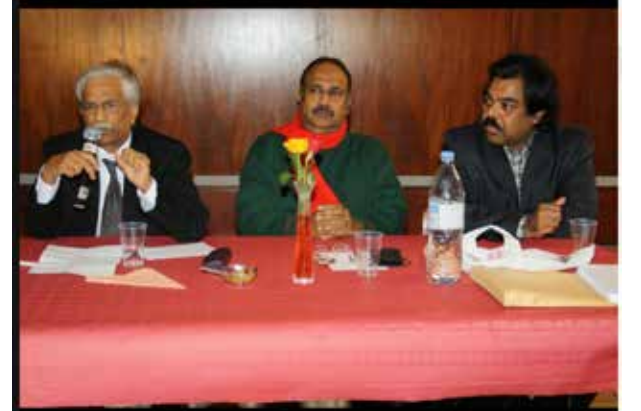
பல்லாண்டுகள் வளமுடன் வாழ வாழ்த்துவோம்..!