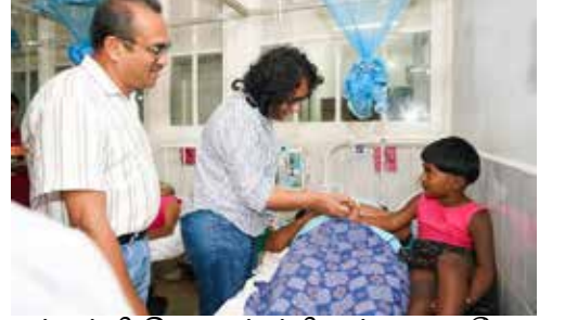
மற்றும் பிரதியமைச்சர் பிரசன்ன குணசேன ஆகியோரும் பிரதமருடன் சென்றிருந்தனர்.