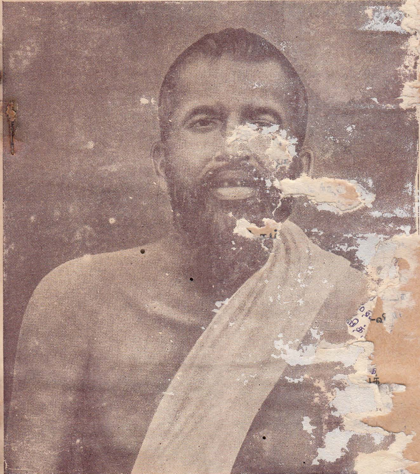
பகவான் ஸ்ரீராமகிருஷ்ண பரமகம்லர்