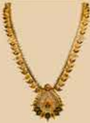
Haram NEK 318 Harams