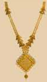
Haram NEK 477 Harams