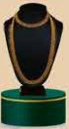
Bridal Set NEK 106 / 375 Harams