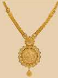
Haram NEK 473 Harams