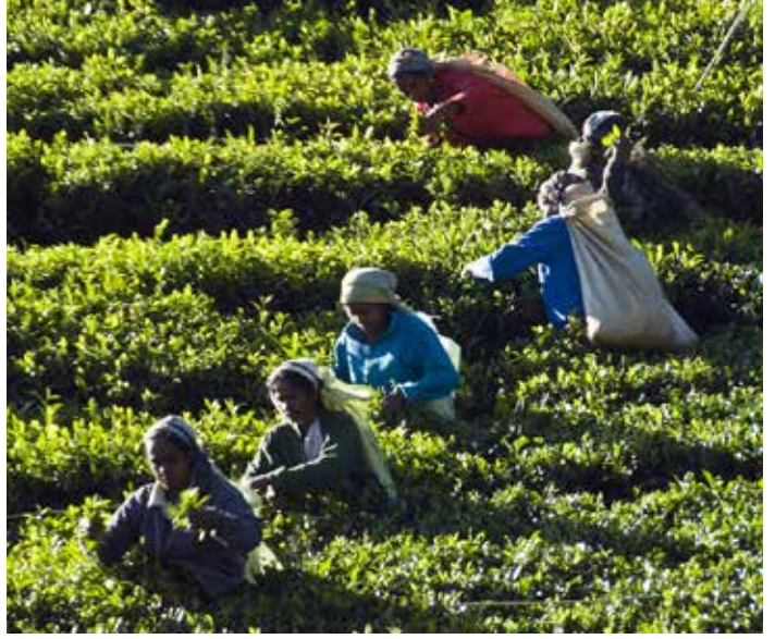
திறன்கள் வளர வாய்ப்புண்டு.

பெண் பிள்ளைகள் கல்விச் சூழலில் பங்கெடுத்தாலும், கிராமிய மட்டத்தில் நடைபெறும் வேலைத்திட்டங்களில் அவர்களின் பங்களிப்பு மிகக் குறைவு. சமூகக் கட்டுப்பாடுகள், பாலின அசமத்துவம், மற்றும் குடும்பச் சமையல் காரணமாக, அவர்கள் சமூக முன்னேற்றத் திட்டங்களில் பங்காற்றும் வாய்ப்புகள் குறைக்கப்படுகின்றன. எனினும், மாணவச் சங்கங்கள், விளையாட்டு குழுக்கள், மற்றும் சமூக சேவைத் திட்டங்கள் மூலமாக பெண்கள் பங்கேற்பை ஊக்குவித்தால், அவர்களின் சமூக அசைவு அதிகரித்து, எதிர்கால தலைமைத்துவத்துக்கான