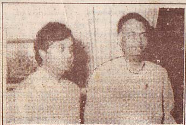
காமினி - இந்திய பாதுகாப்பு அமைச்சர் "கே. சி. மன்" லுடன் 1988 மார்ச் மீதல்

காமினியின் கொலைக்குப் பின்னால்? RAW வின் ஓடுத்த ஏஜன்ட் யார்?