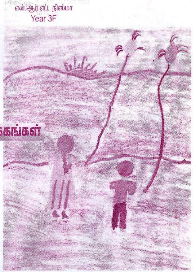
என்.ஆர்.எப். நிஸ்மா Year 3F