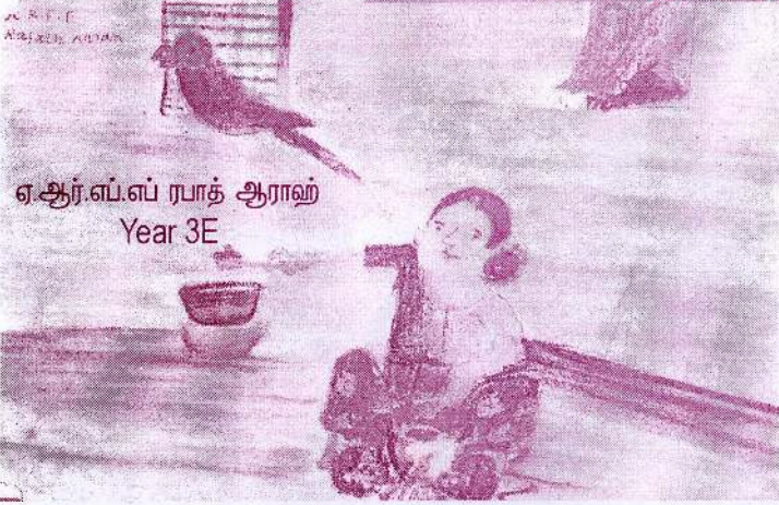
ஏ.ஆர்.எப்.எப் ரபாத் ஆராஹ் Year 3E