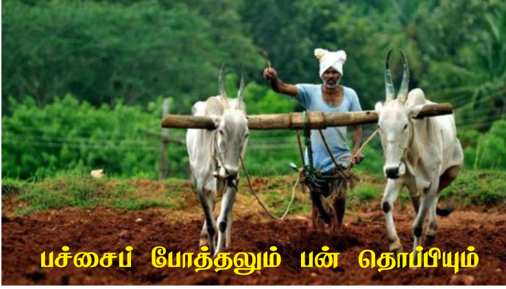
பச்சைப் போத்தலும் பன் தொப்பியும்