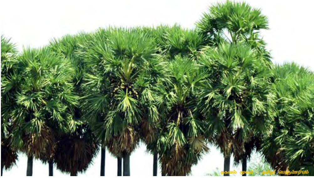
நவலல் மூலம் - தமிழ் பொருண்மியம்