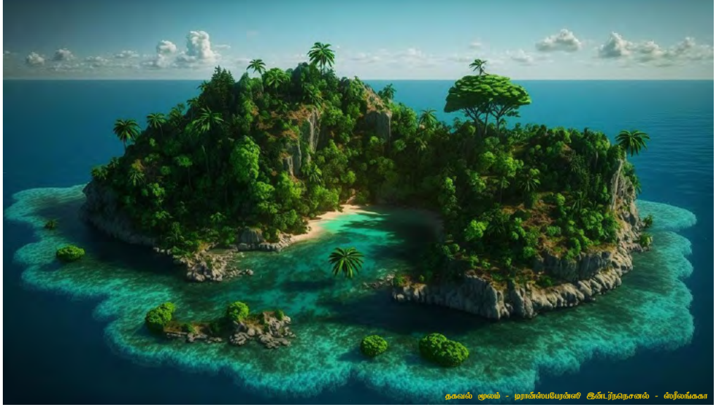
தகவல் மூலம் - ஸ்ராக்ஸ்பெரேக்கள் இயக்குநர், கெளண்டி - சிவலங்கை

3.8 பொது நடவடிக்கைகளுக்காக வழங்கப்படும் காணிகளுக்கான ஆவணம் விகாரைகள் / மத நிறுவனங்கள் / பொதுச் சங்கங்கள் அல்லது அமைப்புகளுக்காக காணி பெறல்.