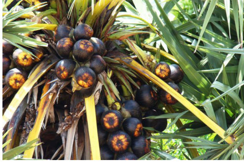
கடந்த மாத இதழின் தொடர்ச்சி...

பனங் கொட்டையை மிருதுவான மண் அல்லது ஈர மணலில் புதைத்து வைத்து இரண்டு மூன்று இலை விட்ட பின் தோண்டி கொட்டைக்குக் கீழ் உள்ள நீண்ட கிழங்கை எடுத்து வேக வைத்துச் சாப்பிட்டால் மிகச் சிறந்த ஊட்ட உணவாகும். சிறு குழந்தைகளுக்கு உடலைத் தேற்றும். பனை மரத்தின் அடிப்பாகத்தில் கொட்டினால் நீர் வரும் அதை கருப்படை, தடிப்பு, ஊரல், சொறி உள்ளவர்களுக்கு அதன் மீது தடவினால் குணமடையும். ஐந்தாறு முறை தடவ வேண்டும். பனையோலை வேய்ந்த இருப்பிடம் ஆரோக்கிய வாழ்வைத் தரும். வெப்பம் அண்டாது. இது விசிறி, தொப்பி, குடை, ஓலைச்சுவடி தயார் செய்யப் பயன்படும். கைவினைப் பொருள்கள் செய்யலாம். இந்தோனேசியாவில் ஓலையை எழுதும் காகிதமாக பயன்படுத்தினார்கள். அதைப் பக்குவப்படுத்த கொதிநீரில் வேக வைத்து மஞ்சள் பொடி இட்டு ஓரத்தில் ஓட்டைகள் போட்டு ஏட்டுப் புத்தகம் உண்டாக்கினார்கள். கண்ணில் புண் ஏற்பட்டால் பனங் குருத்து மட்டையைத் தட்டிப் பிழிந்த சாறு மூன்று நாள் விட குணமடையும் எரிச்சல் தீரும். அடிப்பனை வெட்டிசோறு செய்தார்கள். பனங்கையில் பிரஸ் செய்தனர். கயிறுகள் தயார் செய்தனர். வேலிக்கும் பயன் படுத்தினர். பனையின் எல்லாப்பாகங்களையும் உபயோகப்படுத்தினார்கள். பனை வெல்லம், பனங்கற்கண்டு வாத பித்தம் நீங்கும். பசியை தூண்டும். வெல்லம் அயச்சத்து மிகுந்தது. சோகை நோய்களுக்கு மருந்து. பாலில் பனங்கற்கண்டை சேர்த்து காய்ச்சி குடித்தால் மார்புச்சளி இளகும். முக்கியமாக தொண்டைப்புண், வலி இவை அகலும்.