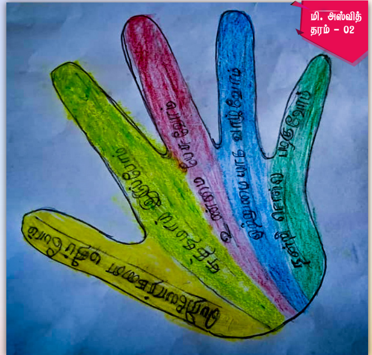
மி. அஸ்வித் தரம் - 02