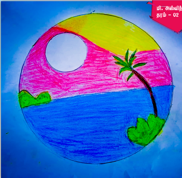
மி. அஸ்வித் தரம் - 02