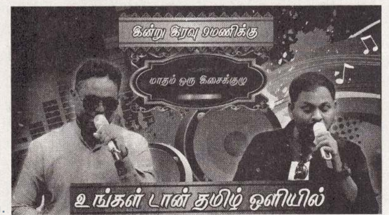
உங்கள் டான் தழிற் ஒளியில்