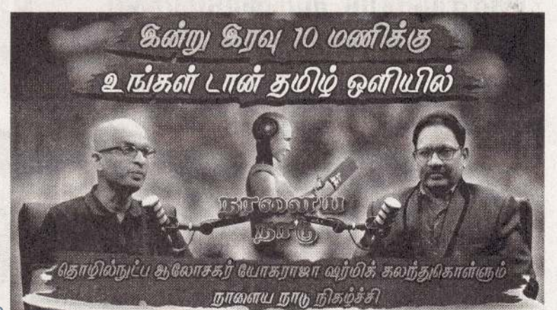
கின்று கிரவு 10 மணிக்கு உங்கள் டான் தமிழ் ஒளியில்