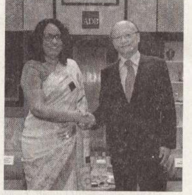
நெருக்கடியின் பின்னர் இலங்கைப் பொருளாதாரத்தை ஸ்திரிப்படுத்துவதற்கு எடுக்கப்பட்டு வரும் முயற்சிகளைப் பாராட்டினார். "டித்வா" சூறாவளி அனர்த்தத்தின்போது ஆசிய அபிவிருத்தி வங்கி வழங்கிய உதவிகளுக்கும், இலங்கையுடன் முன்னெடுத்து வரும் விரிவான அபிவிருத்தி ஒத்துழைப்புகளுக்கும் பிரதமர் ஹரிணி அமரசூரிய தனது நன்றிகளைத் தெரிவித்தார். அத்துடன், இலங்கையின் நீண்டகால அபிவிருத்தி இலக்குகளை அடைவதற்கு ஆசிய அபிவிருத்தி வங்கியின் ஆதரவு இன்றியமையாதது என்பதையும் அவர் வலியுறுத்தினார். (அ)

இலங்கை பிரதமர் ஹரிணி அமரசூரிய, பிலிப்பைன்ஸிற்கான தனது உத்தியோகபூர்வ விஜயத்தின்போது, மணிலாவிலுள்ள ஆசிய அபிவிருத்தி வங்கியின் சிரேஷ்ட அதிகாரிகளுடன் தொடர்ச்சியான இருதரப்பு பேச்சுவார்த்தைகளில் ஈடுபட்டார். இலங்கை மற்றும் ஆசிய அபிவிருத்தி வங்கிக்கு இடையிலான அபிவிருத்தி ஒத்துழைப்பை வலுப்படுத்துதல், நடைமுறையிலுள்ள திட்டங்களை மீளாய்வு செய்தல் மற்றும் எதிர்காலக் கூட்டாண்மை வாய்ப்புகளைக் கண்டறிதல் ஆகியவற்றுக்கு இப்பேச்சுவார்த்தைகளின் போது முன்னுரிமை அளிக்கப்பட்டது. இந்த உத்தியோகபூர்வ விஜயத்தின்போது, பிரதமர் ஆசிய அபிவிருத்தி வங்கியின் தலைவர் மசாட்சு அசகவாவை சந்தித்தார். இச்சந்திப்பின்போது, இருதரப்புக்கும் இடையிலான உறவை மேலும் உறுதிப்படுத்துவது குறித்துக் கலந்துரையாடப்பட்டது. பிரதமரை வரவேற்ற தலைவர் மசாட்சு அசகவா அண்மைக்கால பொருளாதார