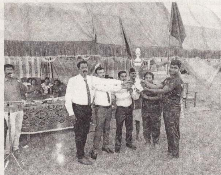
முல்லைத்தீவு மாவட்டத்தின் துணுக்காய் கல்வி வலயத்துக்குட்பட்ட மாங்குளம் மகா வித்தியாலய வருடாந்த இல்ல மெய்வல்லுநர் போட்டி நேற்று முன்தினம் பாடசாலை மைதானத்தில் நடைபெற்றது.