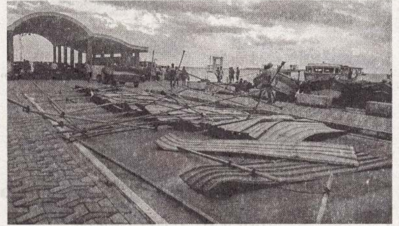
நயினாதீவு இறங்குதுறை பகுதியில் பக்தர்களின் நலன் கருதி

யாழ்ப்பாணம், மார்ச். 21 நயினாதீவில் வீசிய மினி சூறாவளியால் இறங்குதுறை பகுதியில் அமைக்கப்பட்டிருந்த தகர கொட்டகை தூக்கி வீசப்பட்டது.