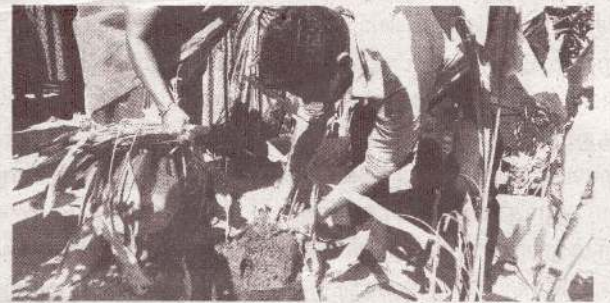
கிளிநொச்சி - முரசுமோட்டையில்

யாழ்ப்பாணம், மார்ச் 28 செம்மணி மனிதப்புதைகுழியில் அடுத்தகட்ட அகழ்வுப் பணிகளை ஆரம்பிப்பதற்கான திகதிகள் தொடர்பில், ஏப்ரல் மாதம் 7ஆம் திகதி தீர்மானம் எடுக்கப்படவுள்ளது. »11