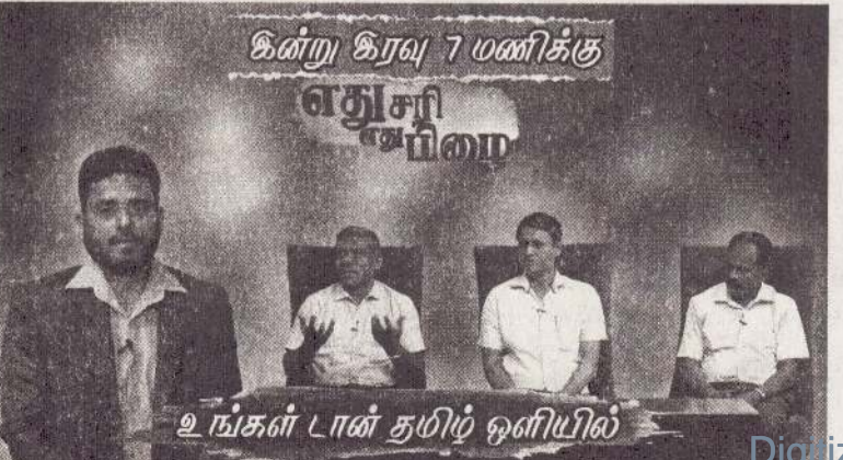
கின்று திரவு 7 மணிக்கு எதுசரி சமீபம் உங்கள் டான் தமிழ் ஒளியில்

தற்போதைய நிலையில் மின்சார விநியோகத்தில் எவ்விதத் தடைகளும் இல்லை எனவும் மின் உற்பத்திக்கான எரிபொருள் கையிருப்பில் உள்ளதாகவும் அவர் சுட்டிக்காட்டினார். இருப்பினும் உச்ச நேரங்களில் மின் தேவை அதிகரித்தால் உற்பத்திச் செலவு உயரும் என்றும், அதன் விளைவாக மின் கட்டணத்தை உயர்த்த வேண்டிய சூழல் ஏற்படும் என்றும் அவர் எச்சரித்தார். (அ)