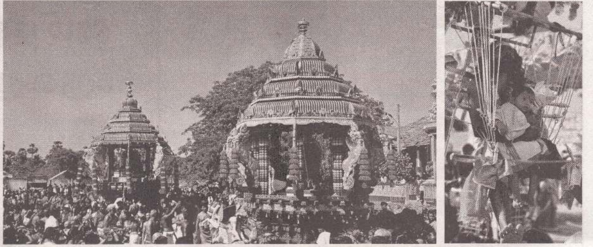
யாழ்ப்பாணம் - சங்கரத்தை பிடிபயம்பதி வீரபத்திரர் சமேத பத்திரகாளி அம்பாள் ஆலயத்தின் வருடாந்த இரதோற்சவத் திருவிழா நேற்று முன்தினம் சிறப்பாக நடைபெற்றது.