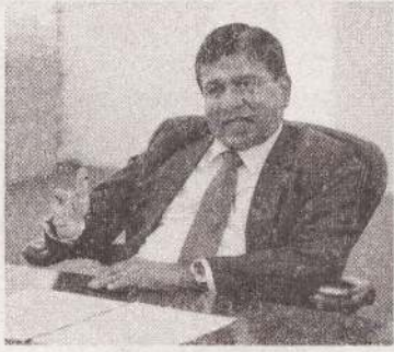
எம். பெரேரா மத்திய நிலையத்தில் நேற்று முன்தினம் நடைபெற்ற ஊடகவியலாளர் சந்திப்பின்போதே அவர் மேற்கண்ட

கொழும்பு, ஏப். 04 பயங்கரவாத தடைச்சட்டத் துக்கு எதிராக முன்வைத்த சட்டமூலத்துக்கு எதிராக மக்கள் விடுதலை முன்னணியினர் தான் நிதிமன்றம் சென்றார்கள். ஆட்சிக்கு வந்தவுடன் பயங்கரவாத தடைச்சட்டத்தை நீக்குவதாக குறிப்பிட்டவர்கள், அந்த சட்டத்தை காட்டிலும் பாரதூரமான சட்டவரைவையே சமர்ப்பித்துள்ளனர் என்று முன்னாள் நிதி அமைச்சர் விஜயதாஸ ராஜபக்ஷ தெரிவித்தார். கொழும்பு- பொரளை என்.