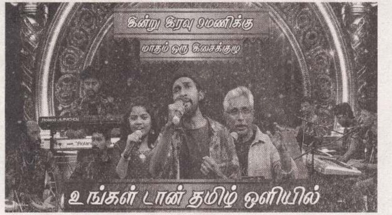
உங்கள் டான் தமிழ் ஒளியில்

ஜனாதிபதி அநுர குமார திலாநாயக்கினால் நேற்று திறந்து வைக்கப்பட்ட நவீனமயமாக்கப்பட்ட புறக்கோட்டை மத்திய பஸ் நிலையத்திற்கு இணையாக, ரயில் நிலையத்தையும் மேம்படுத்தும் நோக்கில் இந்தத் திட்டம் முன்னெடுக்கப்படுகின்றமை குறிப்பிடத்தக்கது. (அ)