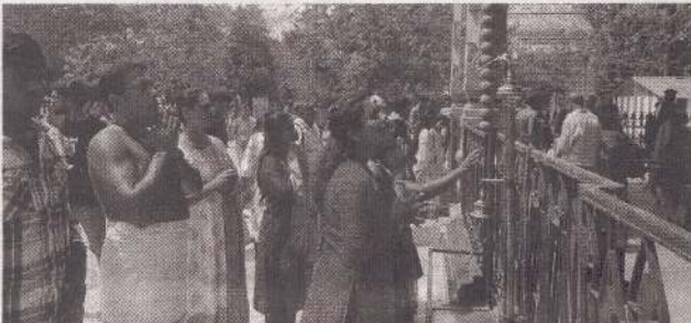
சித்திரைப் புத்தாண்டு தினமான நேற்று மக்கள் நல்லூர் கந்த சுவாமி ஆலயத்தில் சிறப்பு வழிபாடுகளில் ஈடுபட்டனர். (அ)