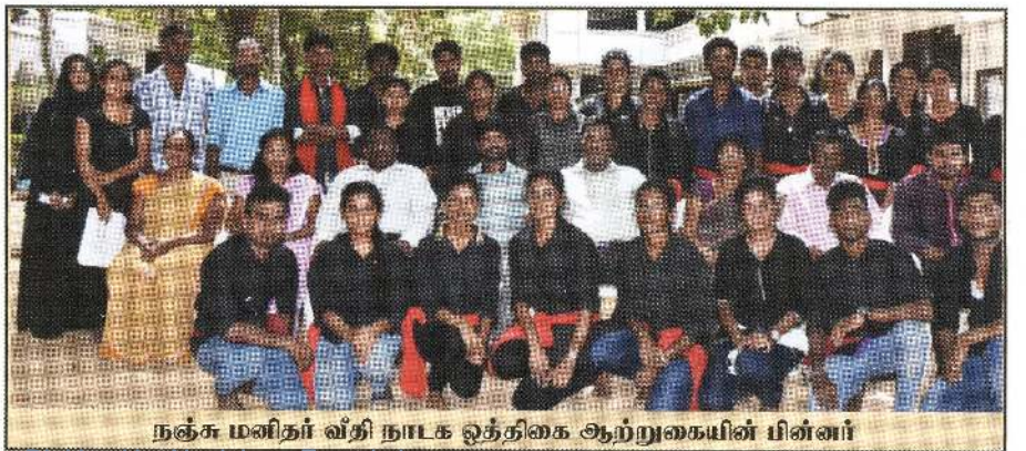
நஞ்சு மனிதர் வீதி நாடக ஒத்திகை ஆற்றுகையின் பின்னர்

இந் நிகழ்வில் சிறப்பு அம்சமாக "பட்டிக் காரர்கள் எதிர் கொள்ளும் சவால்கள்" எனும் தலைப்பில் ஆக்க பூர்வமான கருத்துரைகளும், கலந்துரையாடல்களும் நடைபெற்றன. பாரம் பரியமாக மாட்டுப்பட்டிகளைக் கொண்டு வாழும் விவசாயிகள் வருகை தந்து இந்நிகழ்ச்சியை அர்த்தமுள்ளதாக்கினர்.