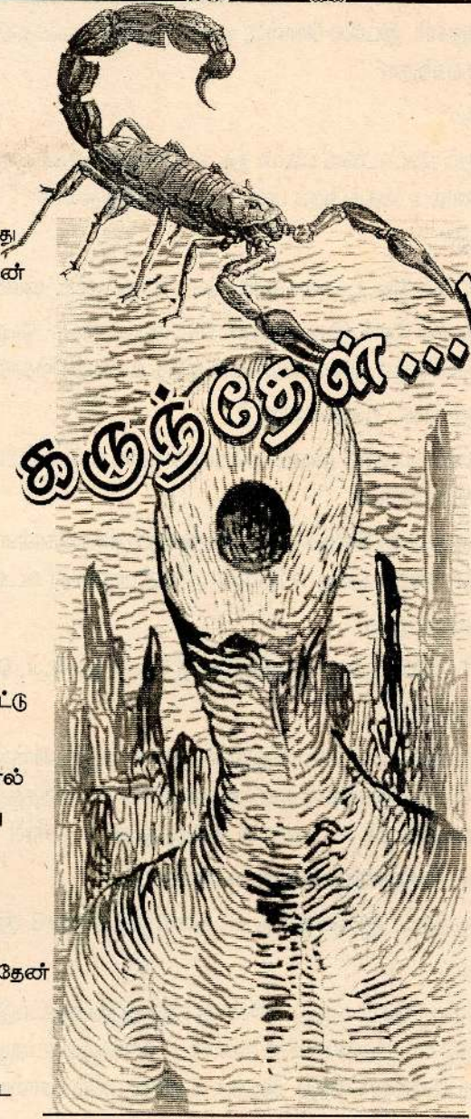
» பைத்தும்புக்குமுன் டேலிட் «

கூர்ந்து பார்த்தேன் தனியார் ரீவியில் தொலைபேசிக் கதைகேட்டு நிற்பானே ஒருவன் அவனின் தலைமுடியோல் சிலம்பலாய்த் தெரிகிறது என்னவாயிருக்கும்...? உலரந்த தடியொன்றை உடனெடுத்து வந்தேன் தட்டித் தட்டி இழுத்தெடுத்தேன் சிரிப்போ சிரிப்பு சின்ன மகனின் கிழிந்துபோன காற்சட்டை காலால் எற்றி வீசவே