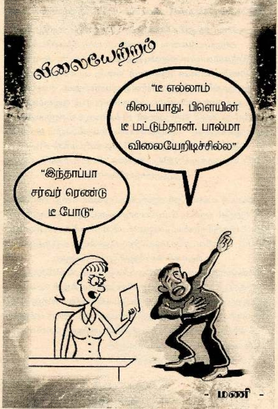
- மணி -

உடனே 'எக்ஸுக்கு' புரிந்துவிட்டது. கருமபீடத்திற்கு வெளியே வந்துவிட்டார். நண்பரின் 'பேர்சை' திறந்து பார்த்தார். அதில்