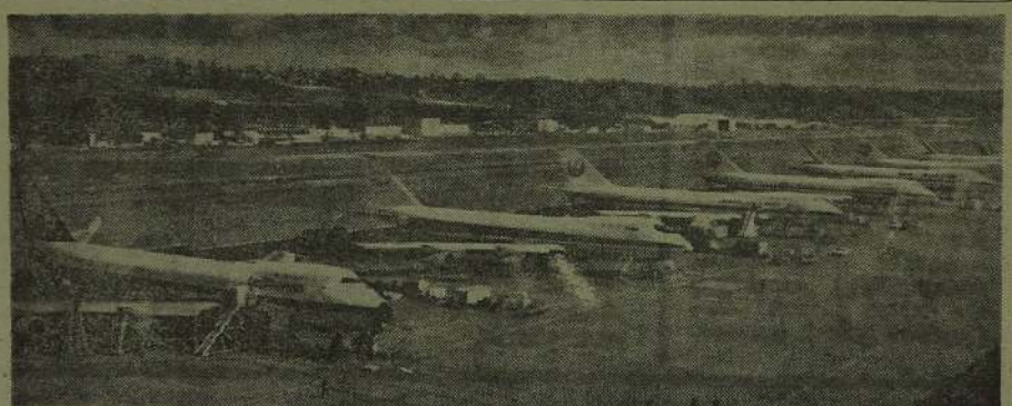
எண்ணெய் நெருக்கடி ஒரு புறம் வளர்ச்சியடையும் அதே சமயம் புதிய விமானக்

வருகிற 22-ம் திகதி இந்தியா செல்லும் பிரதமர் சிறிமாவோ வருகிற 26ம் திகதி இடம் பெறவிருக்கும் இந்திய குடியரசு தினக் கொண்டாட்டத்தில் கௌரவ விருந்தினராகக் கலந்துகொள்வார்.