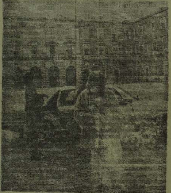
யோகி மகரிஷி மகேஷின் சமீபத்திய படம்

புராண காலத்தில் சேந்தனார் எனும் நடராஜ பக்தர் இருந்தார். அவர் சிதம்பரத்திற்குப் பொருள் தேடச் சென்று, விரகு வீற்ற பணத்தைக் கொண்டு சிவனடியார் ஒருவரைத் தினமும் போஷித்து வந்தார். ஒருநாள் திருவாதிரையன்று பெருமழை பெய்த காரணத்தினால் இவரது ஈர விறகினை வாங்குவாரிலை, அதனால் அவர் பண்டமாற்று முறையில் விறகிற்குப் பதில் ஓளவு அரிசி மாவைப் பெற்றுக் கொண்டார். பின் அரிசிமாவைக் கொண்டு கனி சமைத்து நடராஜப்பெருமானுக்கு நிவேதித்தார். பின் தான் சாப்பிடுவதற்கு முன்பு