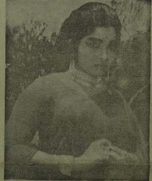
இது கோபமா? நாணமா? இந்தப் போல் எந்த வகையைச் சேர்ந்தது அதற்கு நடிகை ஜெயலலிதாவைத் தான் கேட்க வேண்டும்.