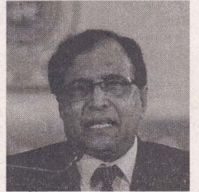
கடைசியாக 2014 ஆம் ஆண்டு மாகாண சபைத் தேர்தல்கள் நடைபெற்ற நிலையில், தொகுதி எல்லை நிர்ணய அறிக்கையில் ஏற்பட்ட சிக்கல்கள் காரணமாகத் தேர்தல் தொடர்ந்து இழுபறி நிலையில் உள்ளமை குறிப்பிடத்தக்கது. (அ)

இது தொடர்பாக ஜனாதிபதியின் செயலாளருக்குப் பலமுறை கடிதங்கள் எழுதப்பட்ட போதிலும், விடயம் தற்போது பாராளுமன்றத் தெரிவுக்குழுவின் கீழ் உள்ளதாகப் பதில் கிடைத்துள்ளதாக அவர் குறிப்பிட்டார்.