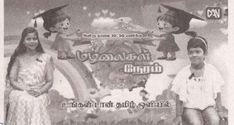
உங்கள் பான் தமிழ் ஒளியில்

இந்தக் கைது நடவடிக்கைகள் காரணமாக, தற்போது பல குற்றவாளிகள் மத்திய கிழக்கிலிருந்து ஐரோப்பிய நாடுகளுக்கு தப்பிச் செல்ல முயற்சிப்பதாகவும் தகவல்கள் வெளியாகியுள்ளன. (எ)