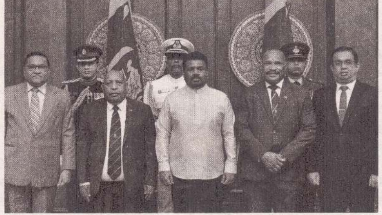
தனர். இதனைத் தொடர்ந்து அவர்களுடன் ஜனாதிபதி சுமுகமான உரையாடலில் ஈடுபட்டதோடு வெளிவிவகார அமைச்சர்

கொழும்பு, ஏப். 21 இலங்கைக்கு புதிதாக நியமிக்கப்பட்டுள்ள நான்கு தூதுவர்கள் மற்றும் இரண்டு உயர்ஸ்தானிகர்களின் நற்சான்றிதழ் பத்திரங்கள் ஜனாதிபதி அநுரகுமார திலகநாயக்கவிடம் கையளிக்கப்பட்டன. நேற்று முற்பகல் ஜனாதிபதி அலுவலகத்தில் வைத்து நற்சான்றிதழ் பத்திரங்கள் கையளிக்கப்பட்டன. பப்புவா நிபூ கினியாவின் உயர்ஸ்தானிகர், சோமாலியாவின் தூதுவர், லட்சம்பேர்க் தூதுவர், வத்திக்கானின் அப்போஸ்தலிக்க தூதுவர், பாகிஸ்தான் உயர்ஸ்தானிகர், குவைத் தூதுவர் ஆகியோர் தமது நற்சான்று பத்திரங்களை கையளித்