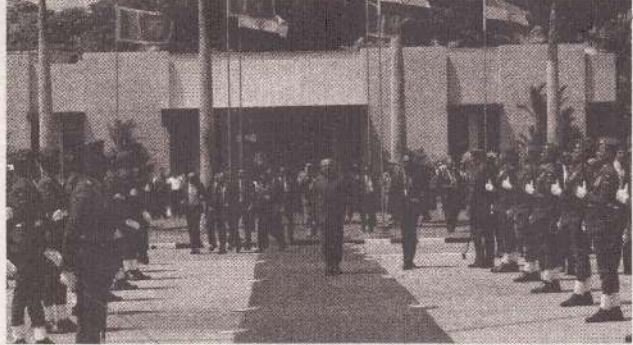
கொழும்பு, ஏப். 21

இலங்கை விஜயத்தை நிறைவு செய்து இந்தியா திரும்பிய நுணை ஜனாதிபதி