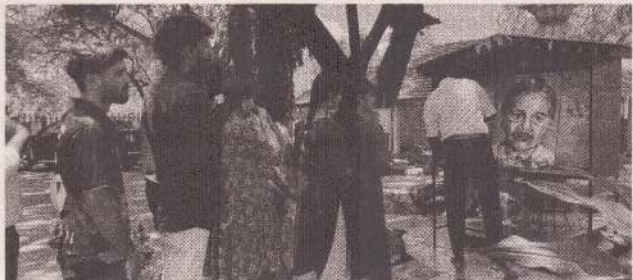
யாழ்ப்பாணம், ஏப். 21

யாழ்ப்பாணத்தில் அன்னை யூதியின் 38 ஆம் ஆண்டு நினைவு நிகழ்வு நிகழவேந்தல்