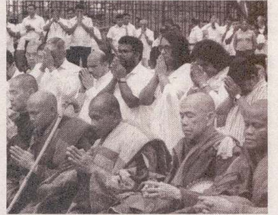
கம்மன வித்தியாவர்த்தன பிரிவேனா போக்குவர விவகாரத்தில் நிறைவடையவுள்ளது. (எ)

உலக அமைதியை வலியுறுத்தி “அமைதிக்கான நடைபயணம்” எனும் மகுடத்தின் கீழ் அமெரிக்காவில் 110 நாட்கள் நடைபயணத்தை மேற்கொண்ட பஞ்சாபு தேரர் உள்ளிட்ட மகா சங்கத்தினர், தற்போது இலங்கையில் தமது பயணத்தைத் தொடர்ந்து வருகின்றனர். தம்புள்ளையிலிருந்து கொழும்பு கங்காராமய வரை முன்னெடுக்கப்படும் இந்த அமைதி நடைபயணத்தின் மூன்றாம் நாள் நிகழ்வு, நேற்று கண்டி சிறீ தலதா மாளிகையிலிருந்து ஆரம்பமானது.