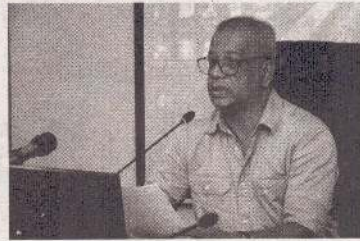
கையை சவால்களை எதிர்த்து கொள்ள எம்மால் முடியும் என அவர் குறிப்பிட்டார். இவ்வாறான விமர்சனங்கள் ஒரு பாரிய சவாலாக இல்லை எனக் கருதுவதாகவும், அதனை வெற்றி கொள்வதற்கு தமக்கும், அரசுக்கும் முழுமையான ஆற்றல் இருப்பதாகவும் அவர் தெரிவித்தார். (அ)