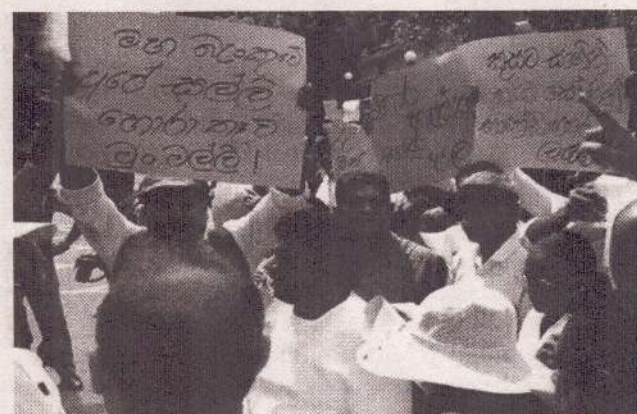
ஏற்பாடு செய்யப்பட்ட மற்றுமொரு எதிர்ப்புப் போராட்டமும் நேற்று மத்திய வங்கிக்கு முன்பாக இடம்பெற்றது.

பாராளுமன்றம் என்பது நாட்டின் நிதி தொடர்பான முழுமையான பொறுப்புள்ள நிறுவனமாகும். ஆனால், பல மாதங்களாக இந்த மோசடித் தகவலை அரசு இரகசியமாக வைத்திருந்தது ஏன்? பாராளுமன்றத்துக்கோ அல்லது நிதி தொடர்பான குழுவுக்கோ இது தெரியப்படுத்தப்படவில்லை. ஜனாதிபதிக்கும் இது தெரிந்தே மறைக்கப்பட்டதா?"-என்றார். (அ)