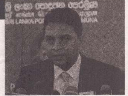
ரிய கொடுக்கல் வாங்கல் என அவர் சாடினார்.

இந்தக் கொள்ளையை ஒரு ஹக்கர் மீது சுமத்த அரசாங்கம் முயன்றாலும், இது மிகவும் சந்தேகத்திற்கு