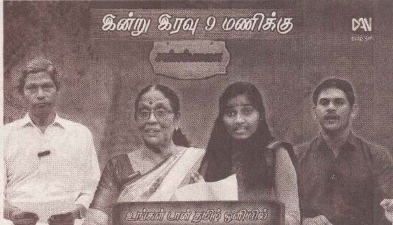
கின்று கிரவு 9 மணிக்கு வங்கர் பார் துறி ஒலியில்

அமைப்பதற்காக அரசாங்கம் ரூபாய் 108 மில்லியனுக்கும் அதிக நிதியை ஒதுக்க திட்டமிட்டுள்ளது. ஒவ்வொரு வீட்டு அலகுக்கும் 28 இலட்சம் ரூபாய் செலவிடப்படுவதுடன், உட்கட்டமைப்பு வசதிகளுக்காக கூடுதலாக ரூ.4 இலட்சம் வழங்கப்படுகிறது. மேலும், ஒவ்வொரு பயனாளிக்கும் 10 பர்ச் நிலப்பரப்பும் வழங்கப்படுகிறது.