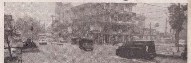
யாழ்ப்பாணம், மே. 16 யாழ்ப்பாணத்தின் பல பகுதிகளில் நேற்று காலை முதல் இடியுடன் கூடிய கனமழை