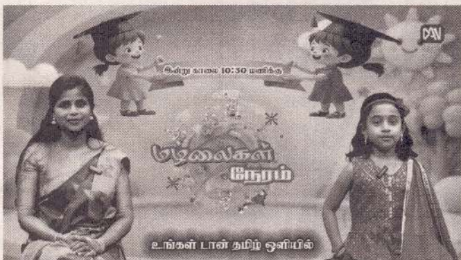
உங்கள் பள்ளி தழிவு ஒளிப்பில்

இதேவேளை, நேற்று காலை 8.30 மணிக்கு நெடுந்தீவு மாவிலித்துறை வீரபத்திரப்பிள்ளையார் ஆலயம், நெடுந்தீவு மாவிலித்துறை சவேரியார் ஆலயம், நெடுந்தீவு தென்னிந்திய திருச்சபை ஆலயம், மற்றும் நெடுந்தீவு தேவசபை ஆலயம் என்பவற்றில் படுகொலை செய்யப்பட்ட உறவுகளின் ஆத்மா சாந்திக்கான வழிபாடுகளும் நடைபெற்றுள்ளன. (அ)