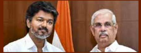
(விரிவான செய்தி 11 ஆம் பக்கத்தில்)