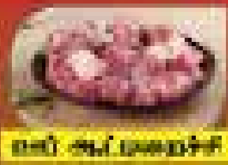
மாட்டி சூப் பசையச்சி