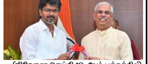
(விரிவான செய்தி 19 ஆம் பக்கத்தில்)

தமிழக முதல்வராக விஜய் இன்று காலை பதவியேற்பு!