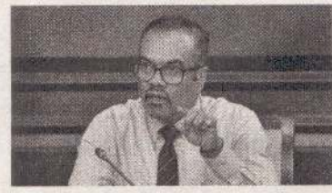
நுகர்வை இயன்றவரை கட்டுப்படுத்தும் நோக்கிலேயே இந்த முறைமை தொடரப்படுவதாக குறிப்பிட்டார்.

கொழும்பு, மே. 20 எரிபொருள் விநியோகத்திற்காக அறிமுகப்படுத்தப்பட்டுள்ள கியூ.ஆர். குறியீட்டு முறைமை தொடர்ந்து நடைமுறைப்படுத்தப்படும் என நிதி மற்றும் திட்டமிடல் பிரதி அமைச்சர் அனில் ஜயந்த பெர்னாண்டோ நேற்று பாராளுமன்றத்தில் தெரிவித்துள்ளார். நாட்டில் எரிபொருள்