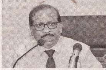
நாடு தனது வரலாற்றிலேயே மிக உயர்ந்த வெளிநாட்டுத் தொழிலாளர் பண்ப்பரிமாற்றத்தைப் பதிவு செய்ய பங்களிப்பு செய்துள்ளதாகவும் அவர் மேலும் கூறினார். (அ)

எதாக அவர் குறிப்பிட்டார். பொதுக்கூட்டம் ஒன்றில் உரையாற்றிய அமைச்சர், தவறான முடிவுகளால் இலங்கை இதற்கு முன்னர் "திசையற்றதாக" மாறியிருந்ததாகவும், ஆனால் தற்போதைய நிர்வாகம் அந்த நிலையை மாற்றியுள்ளதாகவும் வலியுறுத்தினார். வெளிநாடுகளில் வாழும் இலங்கையர்களின் ஆதரவு,