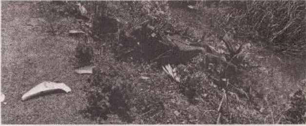
கிளிநொச்சி, மே. 26

கிளிநொச்சியில் மோட்டார் சைக்கிளை வேகமாக ஓடிச் சாகசம் செய்த இளைஞனின் மோட்டார் சைக்கிள் மோதி பாடசாலைக்கு பிள்ளையை ஏற்ற சென்ற தாய் ஒருவர் உயிரிழந்துள்ளார். உருத்திரபுரம் பகுதியில் இடம்பெற்ற இந்த விபத்தில் அப்பகுதியை சேர்ந்த தாய் உயிரிழந்துள்ளார். உருத்திரபுரம் - கரடிப்போக்குச் சந்திக்கு