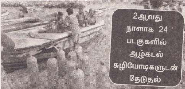
2ஆவது நாளாக 24 படகுகளில் ஆழ்கடல் சுழியோடிகளுடன் தேடுதல்

காணாமற்போன படகுகளில் ஔன்று முழுகியது! மீனவர்கள் அதில் சிக்கியிருக்கலாம் என அச்சம்!!