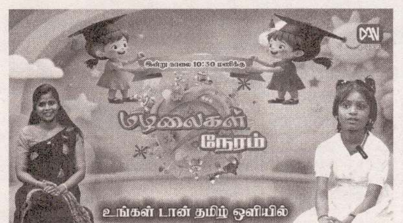
உங்கள் பான் தமிழ் ஒளியில்

கொழும்பு உட்பட பல பகுதிகளில் அமைக்கப்பட்டுள்ள வெசாக் வலயங்களை மையப்படுத்தியும் இந்த விசேட சேவைகள் முன்னெடுக்கப்பட்டுள்ளதாக இ.போ.ச தலைவர் சஜீவ கனகரத்ன குறிப்பிட்டுள்ளார். (அ)