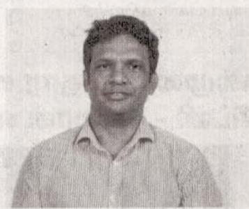
பதிவு செய்துள்ளது. சர்வதேச நாணய நிதியம் இலங்கையின் பொதுத்துறை நிறுவனங்களின் நிதி ஸ்திரத்தன்மையை மீட்டெடுப்பதன் முக்கியத்துவத்தைத் தொடர்ந்து வலியுறுத்தி வரும் நிலையில், இந்த நிறுவனத்தை மிகவும் திறமையானதாக மாற்றுவதற்குப் பொது மற்றும் தனியார் கூட்டு மாதிரித் திட்டம் குறித்தும் பரிசீலிக்கப்பட்டு வருவதாகத் தெரிவிக்கப்பட்டுள்ளது. இதேவேளை, சிறீலங்கை எயார்லைன்ஸ் நிறுவனத்தின் தற்போதைய மொத்தக் கடன் பொறுப்பு 993.78 பில்லியன் அமெரிக்கடாலர்களாகக் காணப்படும் அதேவேளை, அரசு வங்கிகளிடமிருந்து பெறப்பட்ட 91.3 பில்லியன் ரூபாய் கடன்களை மறுசீரமைக்கும் பணிகள் ஏற்கனவே நிறைவடைந்துள்ளதாகத் துறைமுகங்கள் மற்றும் சிவில் விமானப் போக்குவரத்து அமைச்சர் அநுரகுமார திலாநாயக்க தெரிவித்துள்ளார். (அ)