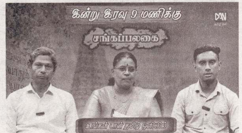
வங்கம் பாய் தம்பி குளியில்