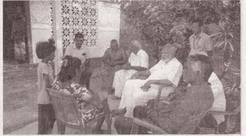
தேடுவதற்கு நடவடிக்கை முன்னெடுக்கப்பட்டது.

யாழ்ப்பாணம், ஜூன். 02 பருத்தித்துறைக் கடலில் மீன்பிடிக்கச் சென்று காணாமல் போன மீனவர்களின் உறவினர்களை முன்னாள் அமைச்சர் டக்ளஸ் தேவானந்தா நேற்று முன்தினம் நேரில் சந்தித்துள்ளார். தொழிலுக்குச் சென்ற மீனவர்களை தேடும் முயற்சிகளில் பலர் ஈடுபட்டிருக்கின்ற போதிலும் இதுவரை திருப்திகரமான பதில் எதுவும் கிடைக்கவில்லை என தெரிவித்துள்ள டக்ளஸ் தேவானந்தா, கடலுக்கு போனவர்கள் உரிய நேரத்துக்கு கரை திரும்பவில்லை என்றதும், கடற்படையினரை அனுப்பி