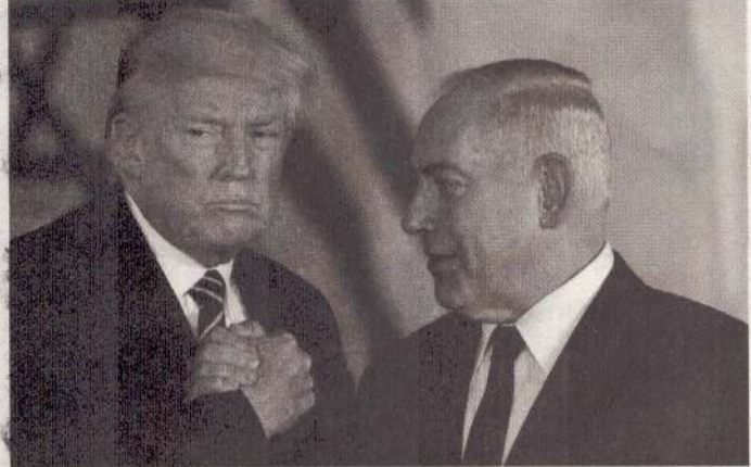
ஈரானுடனான போரிலிருந்து வெளியேற வழிதேடும் அமெரிக்க ஜனாதிபதி, இஸ்ரேல் தீவிரப்படுத்தியிருக்கும் தாக்குதலைக் கட்டுப்படுத்த முயற்சிக்கிறார். ஆனால், மத்திய கிழக்கில் ஏற்பட்டுள்ள கொந்தளிப்பு அவ்வளவு எளிதில் முடிவுக்கு வராது.

மேலும் மே மாத இறுதியில் இஸ்ரேல் தனது தாக்குதலைத் தீவிரப்படுத்தியிருந்தது. ட்ரம்ப்பின் தலையீடு செவ்வாயன்று அது எவ்வளவு காலம் நீடித்தாலும் இறப்பு விகிதத்தைக் குறைக்க வழிவகுத்ததாகத் தோன்றுகிறது. அக்டோபர் மாதம்