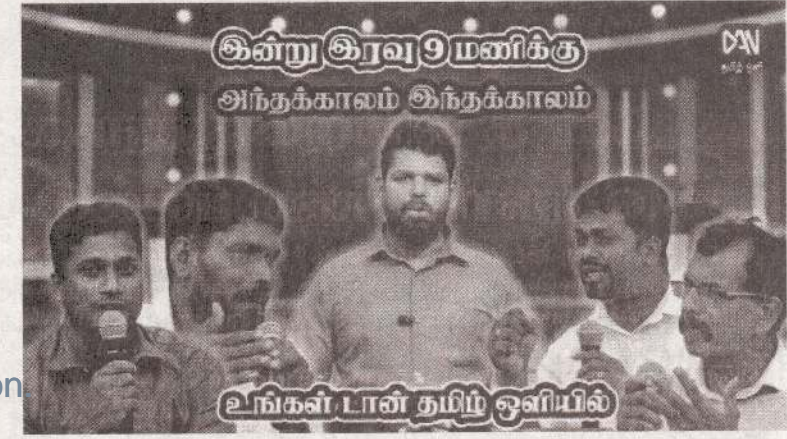
கின்று கிரவு 9 மணிக்கு அந்நககாலம் கிந்நககாலம்

இந்த நிகழ்வில் யாழ் இந்திய துணைத் தூதர் சாய் முரளி மற்றும் தூதரக அதிகாரிகள் என பலரும் கலந்து கொண்டனர்.