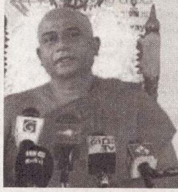
நினைவில் கொள்ள வேண்டும். அரசியலமைப்பின் பிரகாரம் பௌத்த சாசனத்தைப் பாதுகாப்பது அரசாங்கத்தின் தலையாய கடமையாகும்.

இவ்வாறான நபர்கள் வெளிநாடுகளில் இருந்து அல்லது பிற மதக் குழுக்களில் இருந்து நிதி பெற்றுக்கொண்டு பௌத்த சாசனத்தை அழிக்க முற்படுகிறார்களா என்ற சந்தேகம் எழுகிறது. பௌத்த பிக்குகளுக்கும் பொறுமைக்கு ஒரு எல்லை உண்டு என்பதை