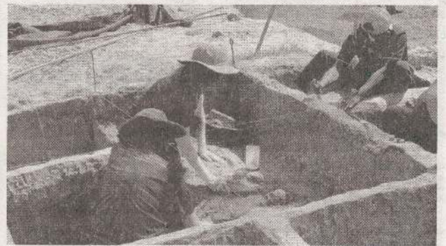
வரை நடைபெற்ற அகழ்வுப் பணிகளின்போது, 302 என்புக்கூடுகள் அடையாளம் காணப்பட்ட நிலையில் 298 என்புக் கூடுகள் முற்றாக அகழ்ந்து எடுக்கப்பட்டுள்ளன.

இந்நிலையில் செம்மணி மனிதப் புகைகுழியில் இது