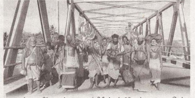
யாழ் - சதிர்காமம் பாதயாத்திரீகர்கள் 18ஆம் நாளான நேற்று முன் தினம் திரியாய் வரத விக்கினேஸ்வரா விநாயகர் ஆலயத்தில் இருந்து குச்சுவெளி பாலம் ஊடாக பயணித்தனர். (அ)

இந்த வரலாற்றுச் சாதனையானது சுற்றுலாத்துறையின் திருப்புமுனை என வெளிநாட்டு அலுவல்கள் அமைச்சர் விஜித் ஹேரத் பாராட்டு தெரிவித்துள்ளார்.