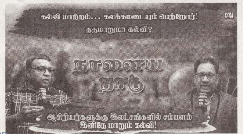
கல்வி மாற்றம்... கலக்கமடையும் பெற்றோர்! கடுமாறுமா கல்வி?

அத்துடன், சில ஆசிரியர்கள் வகுப்புகளின்போது மாணவர்களைத் தரக்குறைவான வார்த்தைகளால் கடிந்து கொள்ளும் வாய்மொழித் துஷ்பிரயோகங்கள் குறித்துப் பெண்கள் மற்றும் சிறுவர் விவகார அமைச்சின் ஊடாகக் கடுமையான சட்ட நடவடிக்கைகள் எடுக்கப்பட்டு வருவதாகவும் அவர் சுட்டிக்காட்டியுள்ளார். (அ)