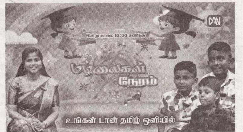
உங்கள் பான் தமிழ் ஒளியில்

இந்தத் திட்டத்தின் கீழ் ஒப்படைக்கப்பட்ட ஆறு குளிரூட்டப்பட்ட வாகனங்கள், வடக்கு மற்றும் கிழக்கு மாகாணங்களிலிருந்து கொழும்புக்கு கடல் பொருள்களைக் கொண்டு செல்வதற்காக இலங்கை மீன்பிடிக்கூட்டுத்தாபனத்தால் இயக்கப்படும் என தெரிவிக்கப்பட்டது. (அ)