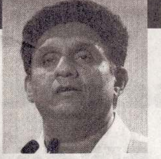
எந்தளவுக்கு உள்ளது என்பதை அறிந்துக் கொள்ளலாம்-என்றார். (அ)

பழைய முறையோ, புதிய முறையோ எந்த முறையிலாவது மாகாண சபைத் தேர்தலை நடத்த வேண்டும் என்று அரசாங்கத்திடம் கேட்டுக் கொள்கிறோம். மாகாண சபைத் தேர்தலை நடத்தினால் அரசாங்கத்தின் மீதான மக்களின் நம்பிக்கை