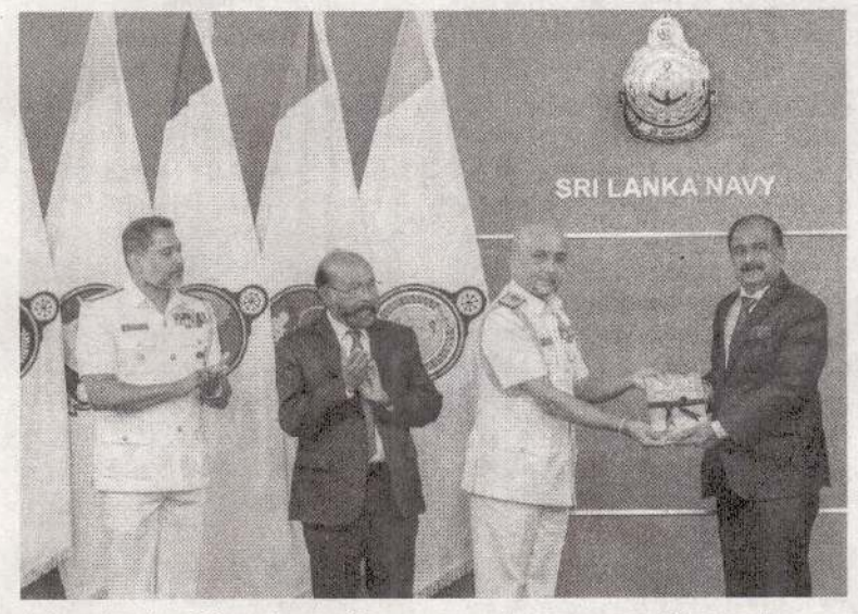
யல் மற்றும் வர்த்தகப் பாரம்பரியம் உள்ளிட்ட துறைகளை உள்ளடக்கிய இந்த நூல், தேசிய அளவில் முக்கியமான ஆய்வு வளமாக இருக்கும் எனவும் அதிகாரிகள் தெரிவித்துள்ளனர். (அ)

கொழும்பு, ஜூன். 15 இலங்கை கடற்படையின் ஆராய்ச்சிப் பிரிவால் தொகுக்கப்பட்ட புதிய ஆய்வு நூல் வெளியீட்டு விழா கடந்த 12ஆம் திகதி கடற்படை தலைமையகத்தில் நடைபெற்றுள்ளது. இந்த நிகழ்வு பிரதி பாதுகாப்பு அமைச்சர் மேஜர் ஜெனரல் அருண ஜயசேகர (ஓய்வு) தலைமையில் இடம்பெற்றது. நிகழ்வில் உரையாற்றிய கடற்படைத் தளபதி வைஸ் அட்மிரல் காஞ்சன பானகொட, இந்த நூல் பல்வேறு கல்வி நிறுவனங்கள் மற்றும் அறிஞர்களின் கூட்டு பங்களிப்பில் உருவாக்கப்பட்டதாக தெரிவித்துள்ளார். மேலும், இலங்கையின் கடல்சார் வரலாறு, தொல்லி