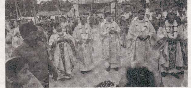
திருவிழாவில் மறைக்கோட்ட குருக்கள், அருட்சகோதரிகள்,