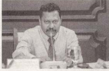
சுகாதார அறிவுறுத்தல்களைக் கடுமையான முறையில் பின்பற்றுமாறு சுகாதார அமைச்சு கேட்டுள்ளது. (அ)

பாலானோருக்கு இந்த புதிய வகை வைரஸ்க்கு எதிரான நோய் எதிர்ப்புச் சக்தி உடம்பில் இல்லை என்பதால், மிக அதிகளவிலான மக்கள் இந்தத் தடவை டெங்கு நோய்த்தாக்கத்திற்கு ஆளாகக்கூடிய அதிக ஆபத்து காணப்படுகின்றது. இதனால் நாடு முழுவதும் இந்நோய் மிக வேகமாகப் பரவக்கூடும் என அவர் குறிப்பிட்டார். மேலும் டெங்கு நோயாளர்களின் எண்ணிக்கை குறிப்பிட்ட கால இடைவெளியில் அதிகரிக்கக்கூடும் என்பதை எதிர்பார்த்து, அதற்கு தேவையான சுகாதார ஏற்பாடுகளை அமைச்சு ஏற்கனவே மேற்கொண்டிருந்தது. இருப்பினும், இம்முறை பரவும் வைரஸ் முற்றிலும் மாறுபட்டதாக அமைந்துள்ளதாக பிரதி அமைச்சர் சுட்டிக் காட்டினார். எனவே, பொதுமக்கள் அனைவரும் டெங்கு நுளம்பு பெருகும் இடங்களை அழித்து,