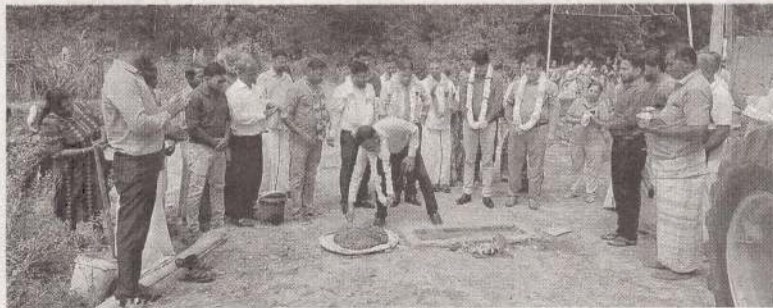
அம்பாறை, ஜூன். 16 கிழக்கு மாகாண விவசாய திணைக்களத்தின் ஏற்பாட்டில் அம்பாறை மத்திய முகாம் நாவி