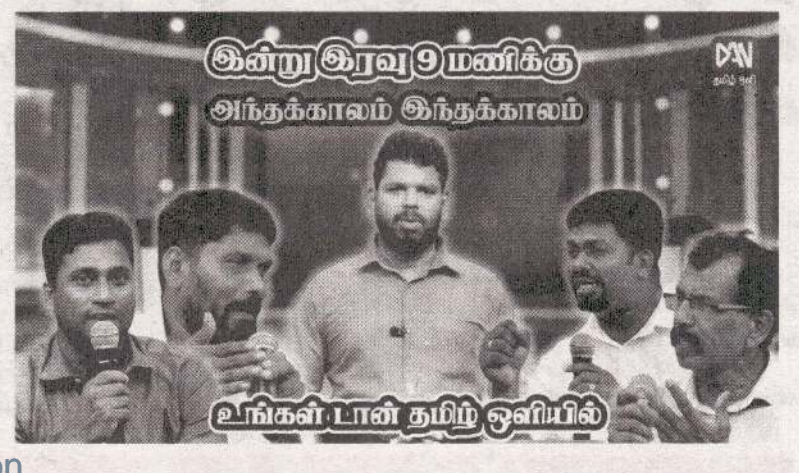
உங்கள் டான் தமிழ் ஒலியில்

னாளி குடும்பங்களுக்கு இக்கொடுப்பனவு கிடைக்கவுள்ளது. இதற்காக அரசாங்கத்தினால் 10,904,801,250.00 ரூபாய் நிதி ஒதுக்கப்பட்டுள்ளது. இந்த தொகையானது நேற்று பயனாளிகளின் அஸ்வெசும வங்கி கணக்குகளில் நேரடியாக வைப்புச் செய்யப்பட்டுள்ளது. இது தொடர்பான விவரங்களை அறிந்துகொள்ள பொதுமக்கள் நலன்புரி நன்மைகள் சபையின் உத்தியோகபூர்வ இணையதளத்தைப் பார்வையிட்டு முடியும் என அறிவிக்கப்பட்டுள்ளது. (அ)