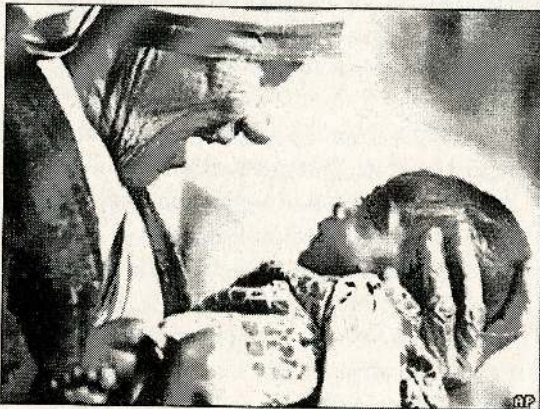
காட்சியும் கவிதையும் 03